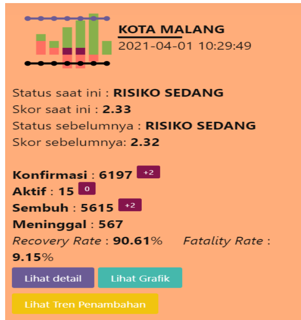
Gambar 2. Persebaran Covid-19 di Jawa Timur

Berdasarkan data gambar 1&2 dapat kita lihat bahwasanya angka pasien yang terkonfirmasi kasus Covid-19 di Kota Malang masih mencapai angka 6197 ribu, disamping itu angka pertumbuhan juga semakin menurun. Per tanggal 2 April 2021, hanya 2 kasus terkonfirmasi positif Covid-19 jelas angka ini sudah menunjukkan angka penurunan yang baik, jika dibandingkan dengan 3 bulan terakhir atau pada menjelang akhir tahun 2020. Penambahan kasus Covid-19 di Kota Malang pada pertengahan bulan Desember 2020, berdasarkan data dari Satgas Covid-19 Kota Malang terdapat tambahan sebanyak 124 orang. Pasien yang meninggal bertambah menjadi lima orang dan yang sembuh bertambah 57 orang. Kasus terkonfirmasi pada tanggal 12 Desember sebanyak 2,648 orang, rinciannya meninggal 259 orang, sembuh 2.214 orang dan dalam pemantauan 175 orang. Sebenarnya angka ini jauh dari sekarang, namun dalam realitasnya pada pertengahan tahun 2020 yang membuat heboh adalah konfirmasi jumlah kematian di Kota Malang yang tinggi (Hamzah 2020).