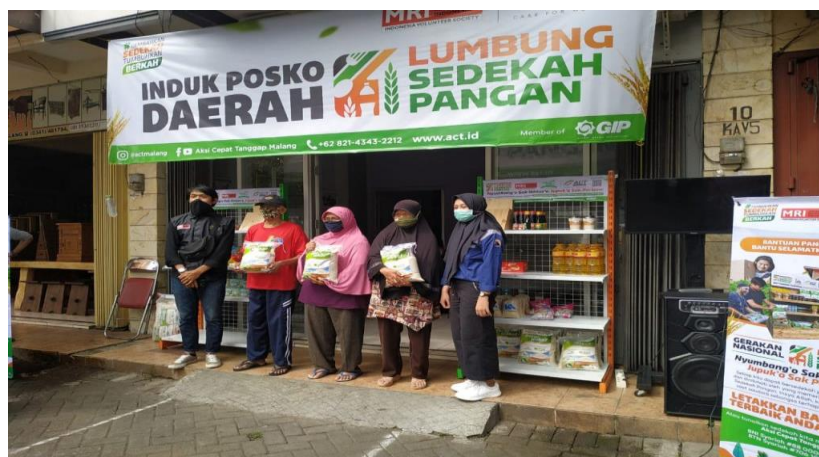
Gambar 3. Posko Lumbung Sedekah Pangan ACT Malang

Pemerintah perlu menentukan kriteria penerima bantuan akibat Covid-19, baik melihat dari segi kerentanan dan keparahan yang kriterianya sesuai dengan situasi dan kondisi lingkungan sosial di daerah Kota Malang. Namun disisi lain pandemic Covid-19 memunculkan satu kebiasaan atau hal baru dimana masyarakat secara sengaja membuat gantungan-gantungan di setiap sudut Rt tempat mereka tinggal, dimana pada gantungan itu diisi dengan sembako, sayur-sayuran, dan bahan pokok. Hal ini merupakan hal positif guna meringankan dampak akibat Covid-19, jadi siapapun boleh manurh dan siapapun boleh mengisinya.